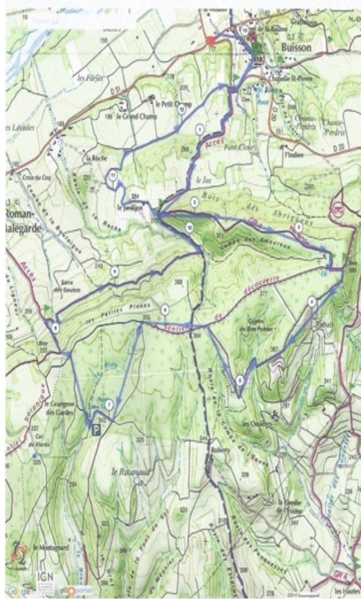
©2016 www.openrunner.com Parcours n°1001740 - Entre Ayguas et Ondaes Départ 8h30 Dimanche 22 mai 2016 - Randonnée Pédestre, 13,256 km - Buisson - Buisson

10/2016 Opérateur - Planificateur de parcours de randonnée multi-activités - Calcul d'itinéraire - Calcul du dénivelé cumulé - Profil altimétrique - Export et Import... Le droit de reproduction est strictement réservé à un usage personnel et privé. Lors de la pratique de votre activité, veillez à respecter les propriétés et champs privés.